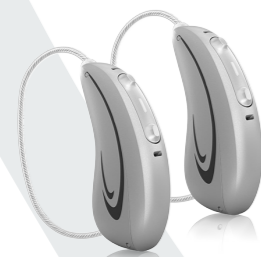
AQ sound FS R vist i naturlig størrelse.

Vær der i øjeblikket... med HANSATON FOKUS