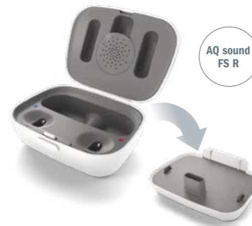
Comfort Charger Combi

Das Herzstück der wiederaufladbaren HANSATON FOKUS Hörsysteme ist der bewährte Lithium-Ionen-Akku mit bis zu 24 Stunden Laufzeit und nur drei Stunden Ladezeit.