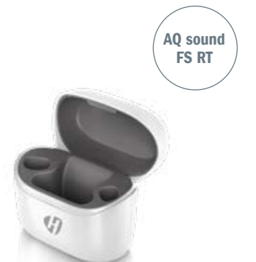
HANSATON T Charger

Mit dem neuen und kompakten HANSATON T Charger werden Hörsysteme mit Lithium-Ionen-Akku innerhalb von drei Stunden aufgeladen. Dank der magnetischen Ladeeinsätze können die Hörsysteme einfach eingesetzt und herausgenommen werden.