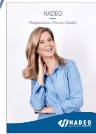
HADEO Produktübersicht 041-6088-01