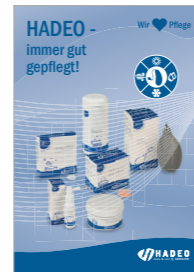
HADEO Einleger Taschen 039-5473