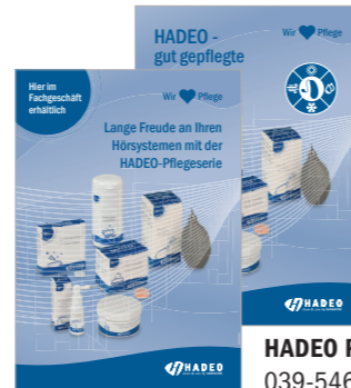
HADEO Poster 039-5467-01