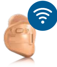
Jazz XC Pro 312 Dir W Accesorios opcionales: Remote Control, PartnerMic, TV Connector