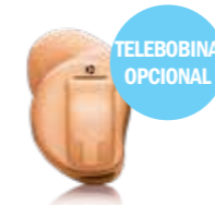
Jazz XC Pro 312