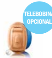
Jazz XC Pro 10